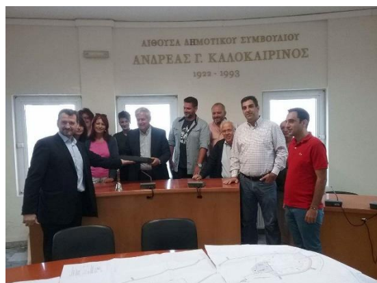
Εικόνα 1. Από την τελετή παράδοσης της μελέτης του Πολιτιστικού

των κοινόχρηστων χώρων κατά μήκος του κεντρικού ρέματος που διατρέχει τον συνεταιρισμό μας μέχρι την είσοδο από την πλευρά του Βιολογικού Καθαρισμού, την κατασκευή Παιδικής Χαράς δίπλα στην κεντρική πλατεία και 2 αθλητικών γηπέδων πολλαπλών αθλημάτων (Μπάσκετ, Βόλεϋ, Τένις και Ποδοσφαίρου 5x5), χώρων στάθμευσης, αστικού εξοπλισμού κλπ. Η μελέτη του κτηρίου του πολιτιστικού έχει ολοκληρωθεί και παραδοθεί επισήμως στον Δήμο Μαλεβιζίου την 18/10/2016