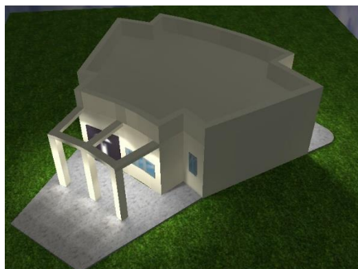
Εικόνα 2. Φωτορεαλιστικό του κτηρίου του Πολιτιστικού

Την Τετάρτη 23 Ιουλίου 2014, υπεγράφη το συμφωνητικό ανάθεσης της μελέτης ανάπλασης του κεντρικού ρέματος του συνεταιρισμού μας από τον ΠΟΣΥΠΑΤΕ, τον Πολιτιστικό Σύλλογο "Αμμούδι" και την ανάδοχο μελετητική ομάδα. Η μελέτη αφορά στην ανάπλαση της κεντρικής πλατείας του συνεταιρισμού ΠΟΣΥΠΑΤΕ και των γύρω χώρων πρασίνου, την έκδοση της οικοδομικής άδειας για κτήριο πολιτιστικών δράσεων εντός της εμβαδού 200 τ.μ. με υπόγειο, την ανάπλαση