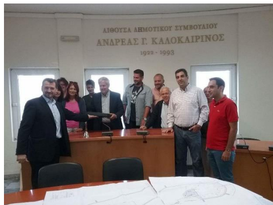
Εικόνα 1 Από την τελετή παράδοσης της μελέτης του Πολιτιστικού την 18/10/2016

πολιτιστικών δράσεων εντός της εμβαδού 200 τ.μ. με υπόγειο, την ανάπλαση των κοινόχρηστων χώρων κατά μήκος του κεντρικού ρέματος που διατρέχει τον συνεταιρισμό μας μέχρι την είσοδο από την πλευρά του Βιολογικού Καθαρισμού, την κατασκευή Παιδικής Χαράς δίπλα στην κεντρική πλατεία και 2 αθλητικών γηπέδων πολλαπλών αθλημάτων (Μπάσκετ, Βόλεϋ, Τένις και Ποδοσφαίρου 5x5), χώρων στάθμευσης, αστικού εξοπλισμού κλπ. Η μελέτη του κτηρίου του πολιτιστικού