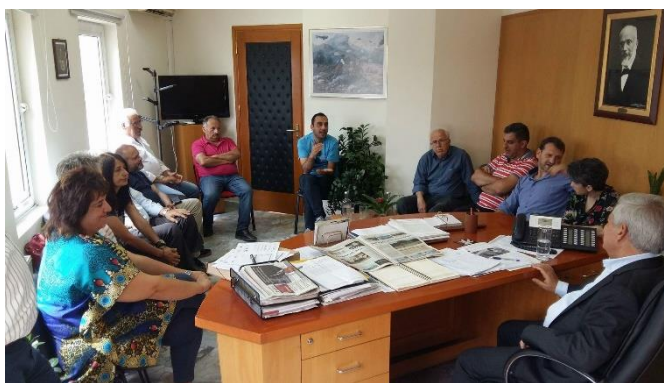
Εικόνα 4 Συνάντηση με τον Δήμαρχο (17/5/2018)

Εντός του 2018 ολοκληρώθηκε και η μελέτη ανάπλασης της κεντρικής πλατείας του συνεταιρισμού ΠΟΣΥΠΑΤΕ και των γύρω χώρων πρασίνου, των κοινόχρηστων χώρων κατά μήκος του κεντρικού ρέματος που διατρέχει τον συνεταιρισμό μας μέχρι την είσοδο από την πλευρά του Βιολογικού Καθαρισμού, της Παιδικής Χαράς δίπλα στην κεντρική πλατεία και 2 αθλητικών γηπέδων πολλαπλών αθλημάτων (Μπάσκετ, Βόλεϊ, Τένις και Ποδοσφαίρου 5x5), χώρων στάθμευσης, αστικού εξοπλισμού κλπ. Παραδόθηκε και αυτή στον Δήμο και θα αναζητηθούν κονδύλια χρηματοδότησης.