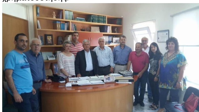
Εικόνα 5 Συνάντηση με τον Δήμαρχο (17/5/2018)

Στις 18/04/2019 με πολύ μεγάλη χαρά πληροφορηθήκαμε ότι εγκρίθηκε η χρηματοδότηση για την υλοποίηση της πρώτης μελέτης μας, αυτής που αφορούσε στην κατασκευή του Πολιτιστικού μας Κέντρου για την περιοχή Αμμουδίου, Λυγαριάς, Μαδέ στην κεντρική πλατεία του συνεταιρισμού μας.