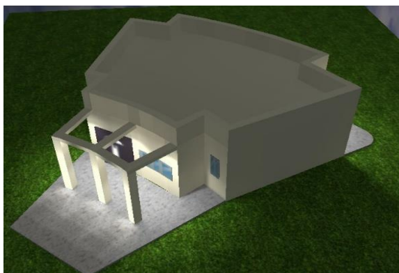
Εικόνα 2 Φωτορεαλιστικό του κτηρίου του Πολιτιστικού

Την Τετάρτη 23 Ιουλίου 2014, υπεγράφη το συμφωνητικό ανάθεσης της μελέτης ανάπλασης του κεντρικού ρέματος του συνεταιρισμού μας από τον ΠΟΣΥΠΑΤΕ, τον Πολιτιστικό Σύλλογο "Αμμούδι" και την ανάδοχο μελετητική ομάδα. Η μελέτη αφορούσε στην ανάπλαση της κεντρικής πλατείας του συνεταιρισμού ΠΟΣΥΠΑΤΕ και των γύρω χώρων πρασίνου, την έκδοση της οικοδομικής άδειας για κτήριο